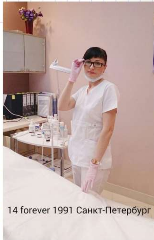
14 forever 1991 Санкт-Петербург

Да потому, что мы научены всему этому ... бороться, не вставать на колени перед трудностями, и еще мы умеем учиться всю жизнь.. учиться всерьез, сдзя за учебниками, сдавая экзамены в сорокалетнем возрасте, меняя с ног на голову свою профессию... Школа, спасибо тебе за всё! Долгих лет и процветания!